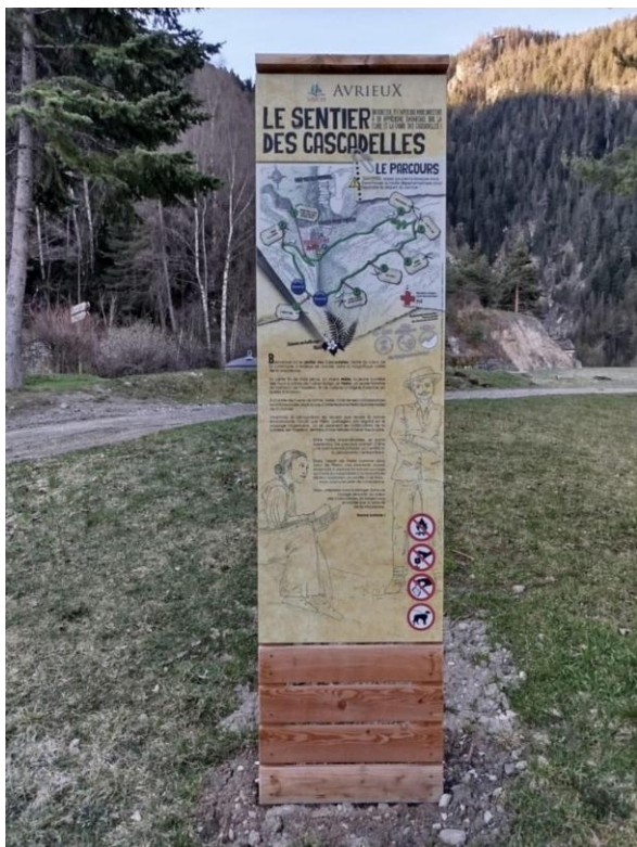
Totem de départ (à l'entrée du fort).