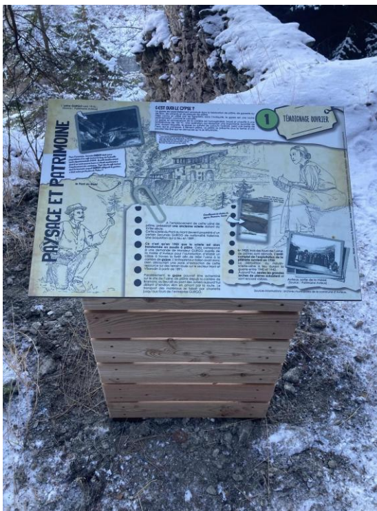
Valorisation pédagogique du sentier et des paysages alentours et histoire du sentier.