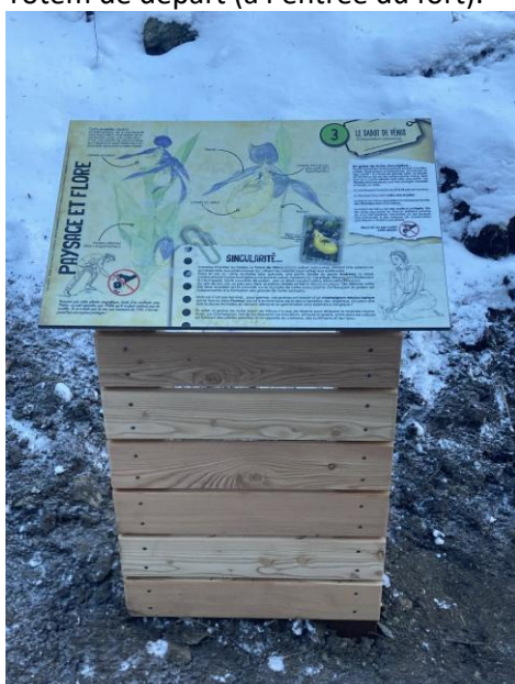
Le Sabot de Vénus valorisé.