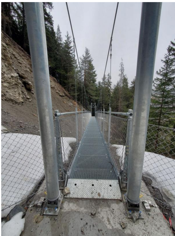
Passerelle et ouvrage en béton armé.