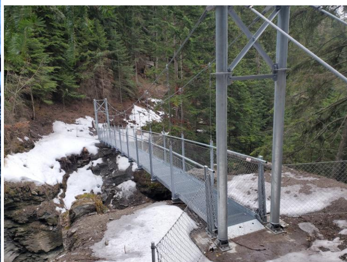
Passerelle et ouvrage en béton armé.