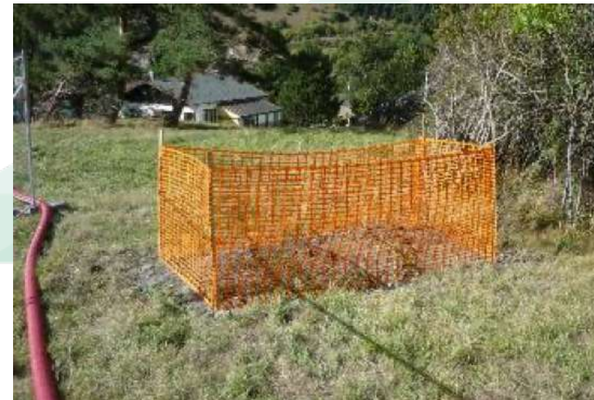
Déplacement des espèces protégées (gentianes croisettes, tulipes)

La circulation sous alternat est indispensable pour ne pas couper la circulation et garantir la sécurité des ouvriers et des usagers de la route. Elle est prévue jusqu'à mi-novembre.