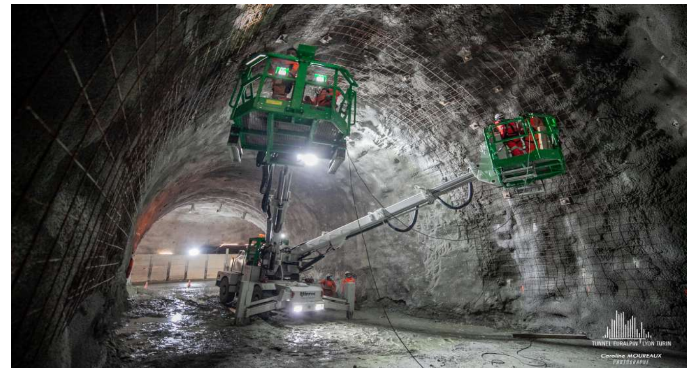
Travaux dans la galerie de connexion à la chambre de pied de puits