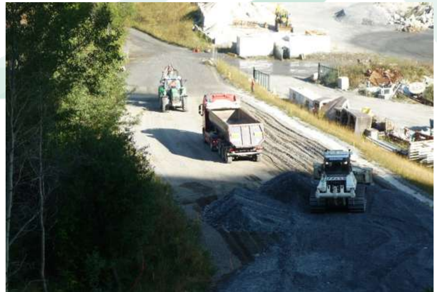
Travaux de terrassement de la section courante de la piste avec arrosage