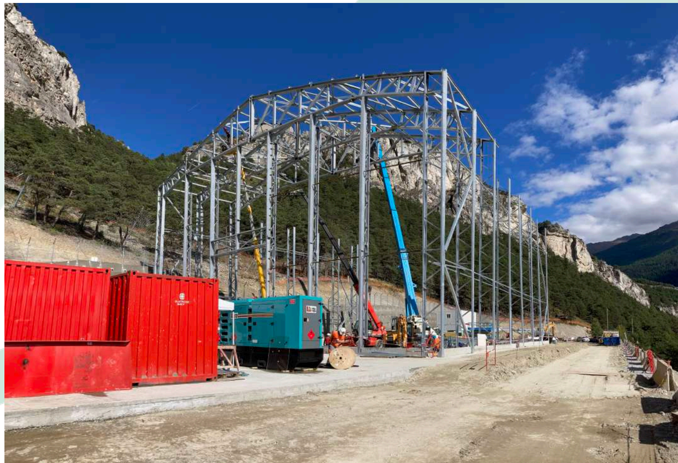
Montage du hangar acoustique