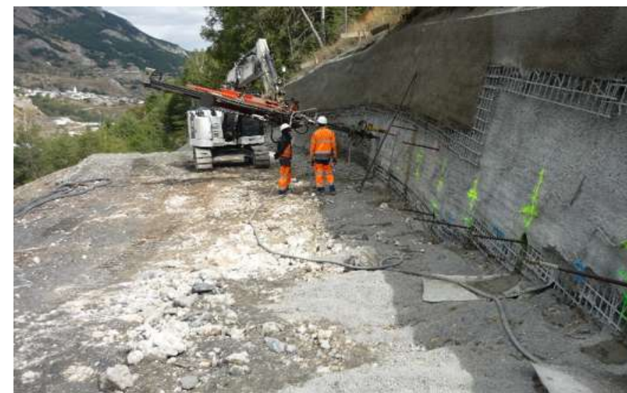
Chantier de la paroi clouée