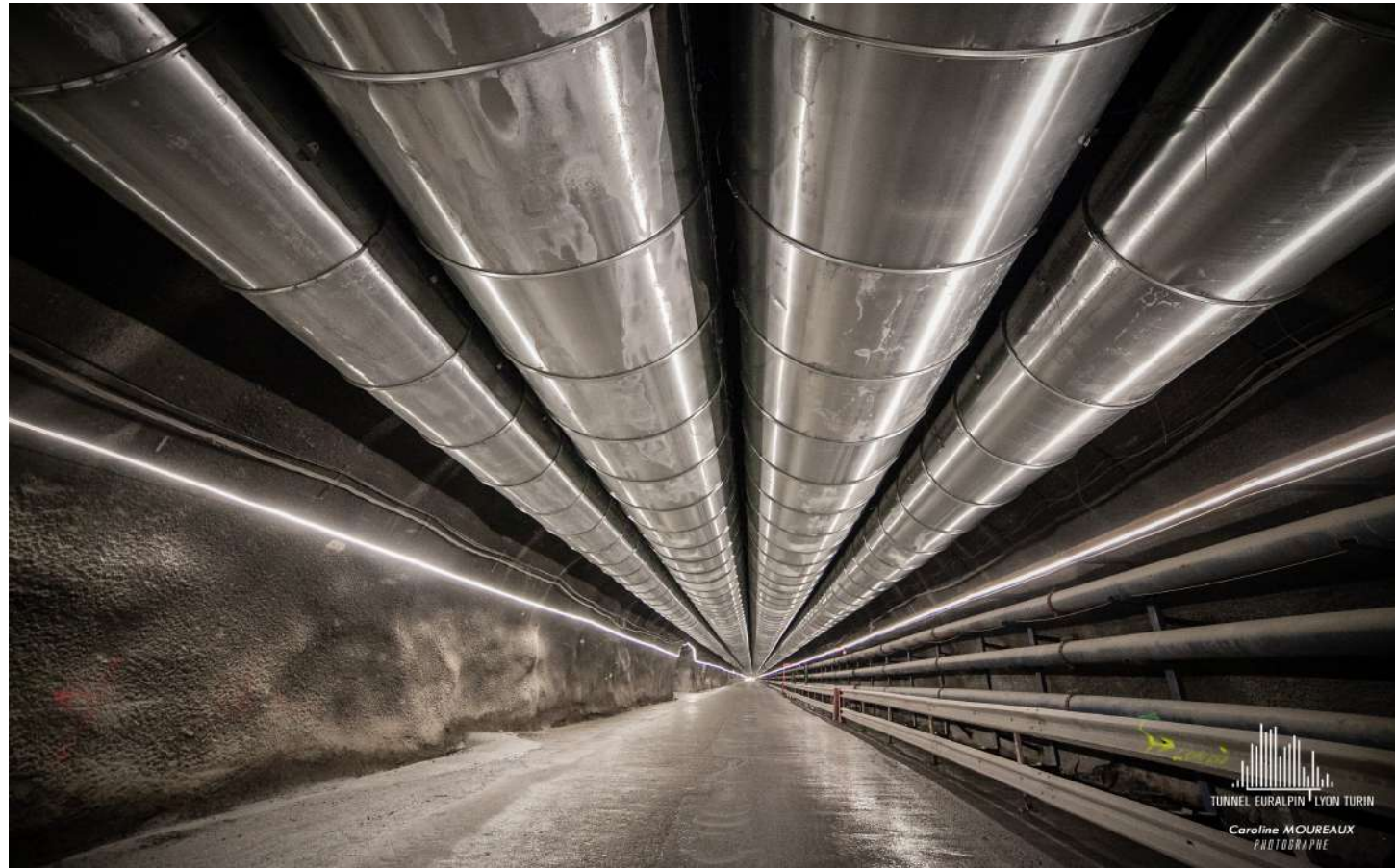
Descenderie de Villarodin-Bourget / Modane