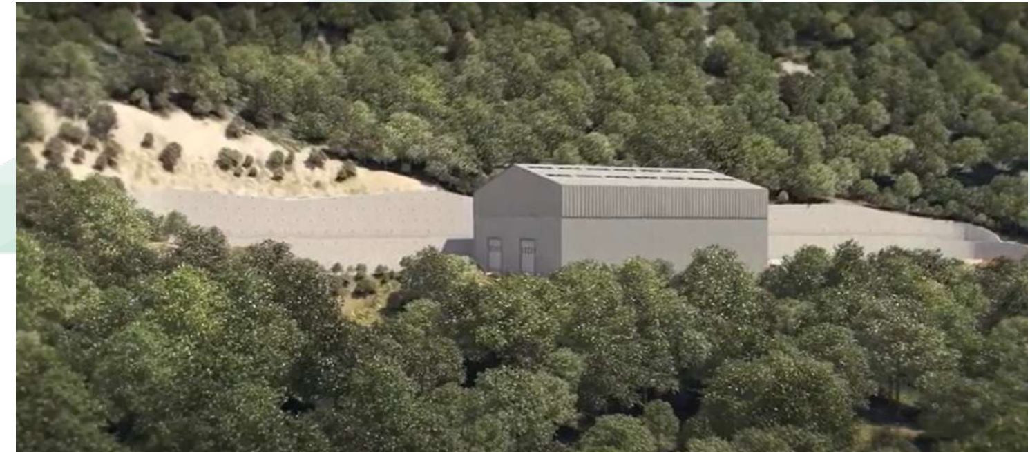
Visualisation du hangar acoustique

Dans 3 ans, le hangar acoustique sera abaissé de moitié. Il restera en place durant 6 années.