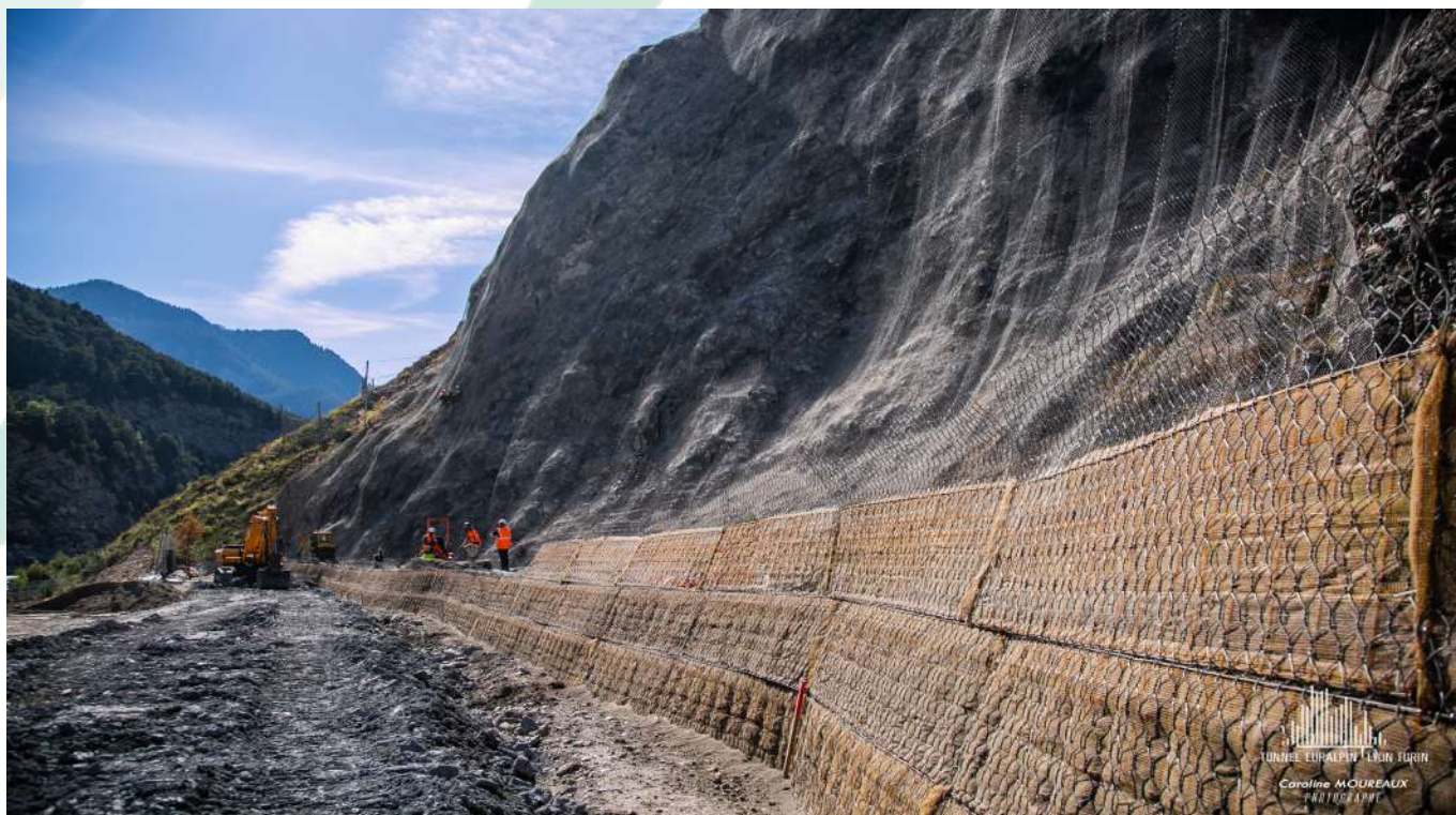
Aménagement et mise en sécurité de la plateforme supérieure de Villarodin-Bourget/Modane